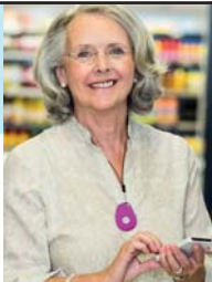
GPS Mobile Above

No Contract • No Fees • Easy Setup • md-medalert.com CALL 800-890-8615